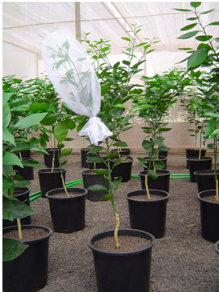
Figura 4. Gaiola de confinamento.