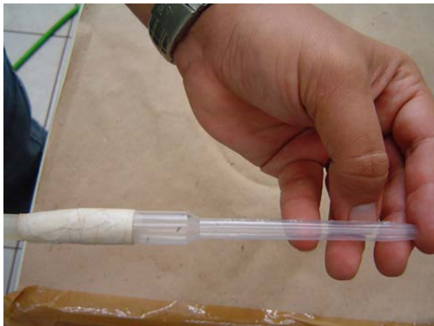
Figura 2. Manipulação de psílídeos.