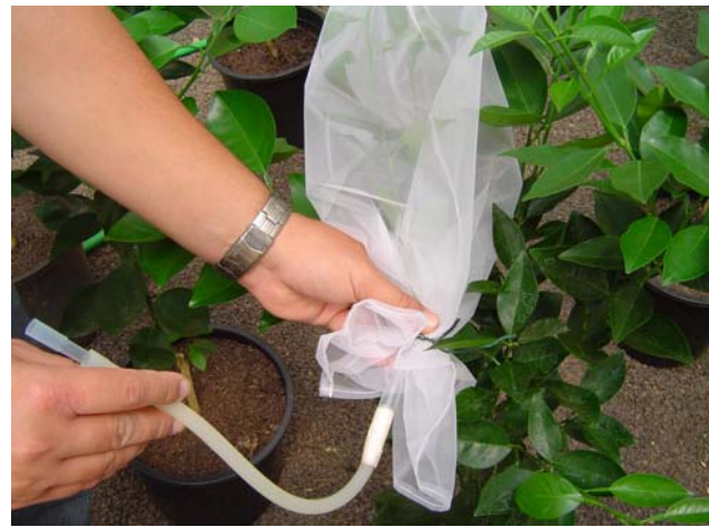
Figura 3. Confinamento de psílídeo.